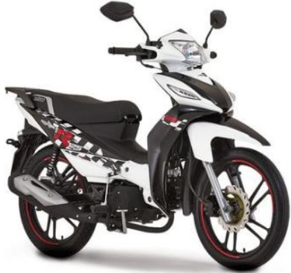
ADVANCE R 125

PSVP: $4.349.000 PSCD: $4.130.000 DESCUENTO: $219.000 BONO empleado $220.000