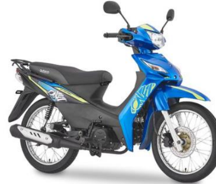
VICTORY ONE – AÑO 2021

PSVP: $3.499.000 PSCD : $3.323.000 DESCUENTO: $176.000 BONO empleado $180.000