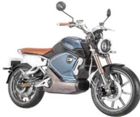
SUPER SOCO TC1900

PSVP: $8.990.000 PSCD: $8.560.000 DESCUENTO: $430.000 BONO empleado $430.000