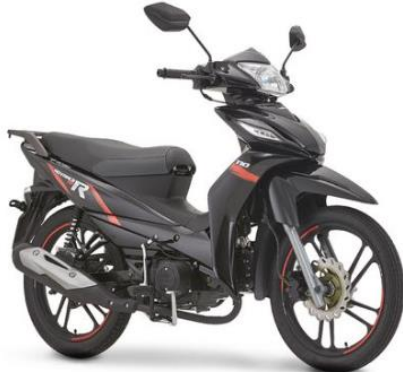
ADVANCE R 110

PSVP: $4.149.000 PSCD: $3.940.000 DESCUENTO: $209.000 BONO empleado $210.000