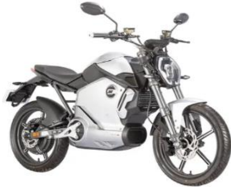
SUPER SOCO TS1200

PSVP: $7.990.000 PSCD: $7.610.000 DESCUENTO: $380.000 BONO empleado $380.000